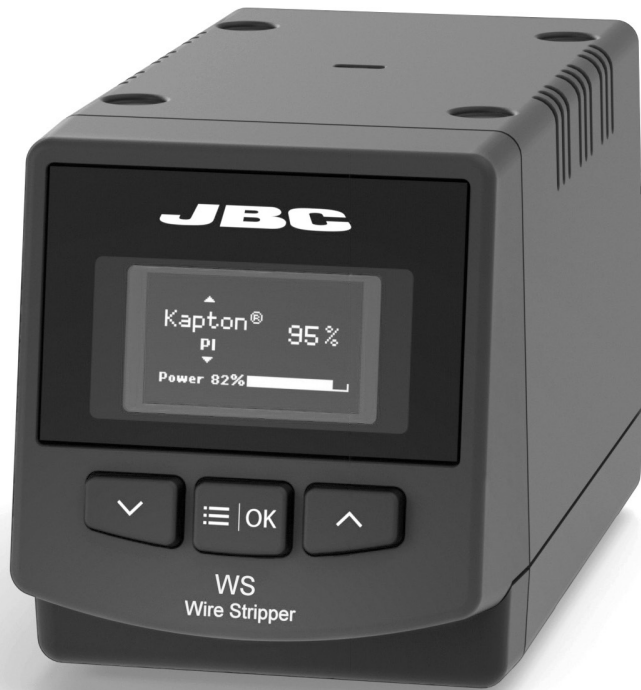
WS 精密高温ワイヤーストリッパ ステーション