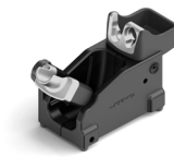
JTS 工具座 ..... 1 件 料号 JT-SF