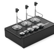
ESHT 保护罩和真空吸杆盒 ..... 1 件 料号 ESHT-A