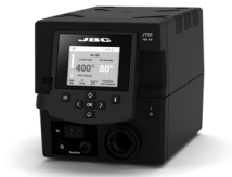
JTSE 热风主机 ..... 1 件 料号 JTSE-2HUA (230 V)